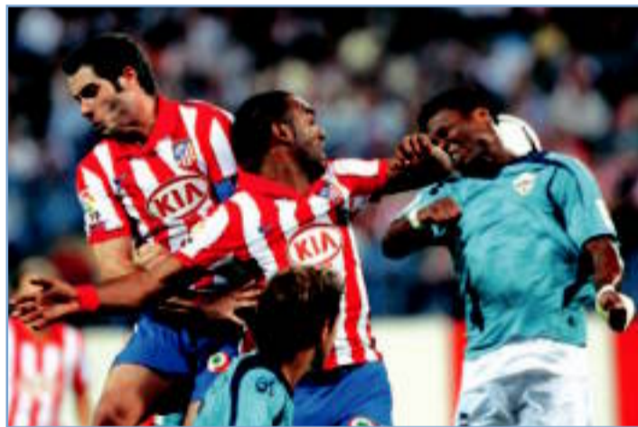
El Almería ya dio la sorpresa en la primera vuelta