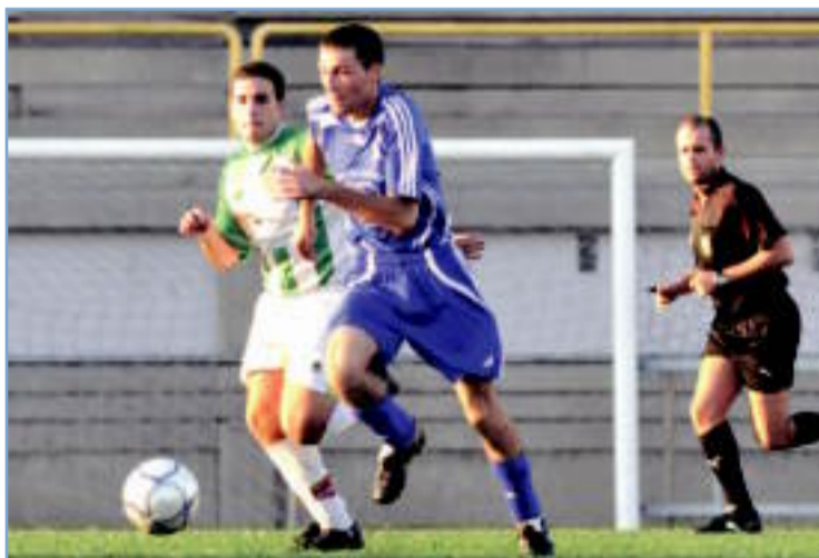
El Oza dos Ríos rompió su racha negativa

Con el justo marcador inicial se llegó al descanso, pero tras él todo dio un giro. Los visitantes supieron leer mucho mejor sus necesidades y se adelantaron con un polémico tanto. Casti , en posición muy protestada por el Oza Juvenil, ganó la línea de fondo y cedió atrás, desde donde Moisés anotó el 0-1. Un golpe que los her-