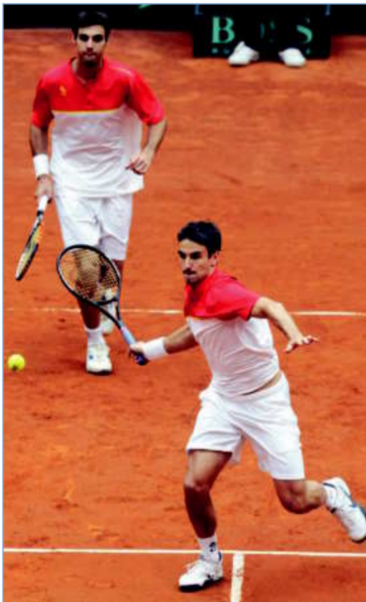
La dupla española funcionó a la perfección en Logroño